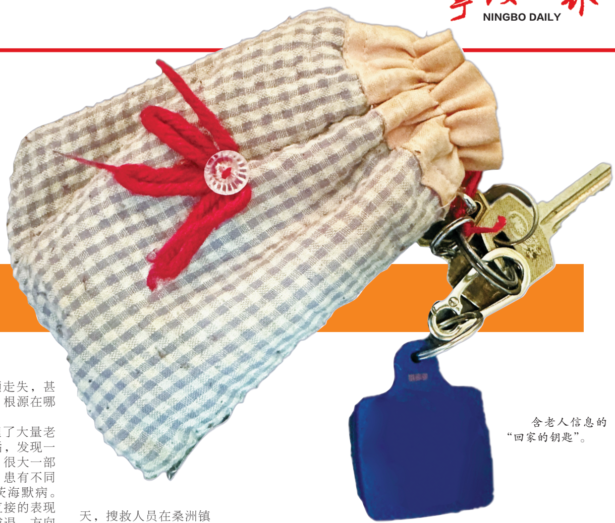
含老人信息的“回家的钥匙”。