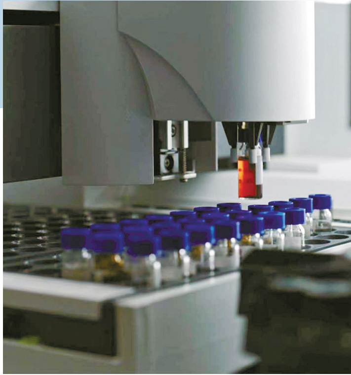
在卢米蓝检测实验室内，气相色谱仪机械臂正在抓取红光材料样品瓶进行自动化检测。