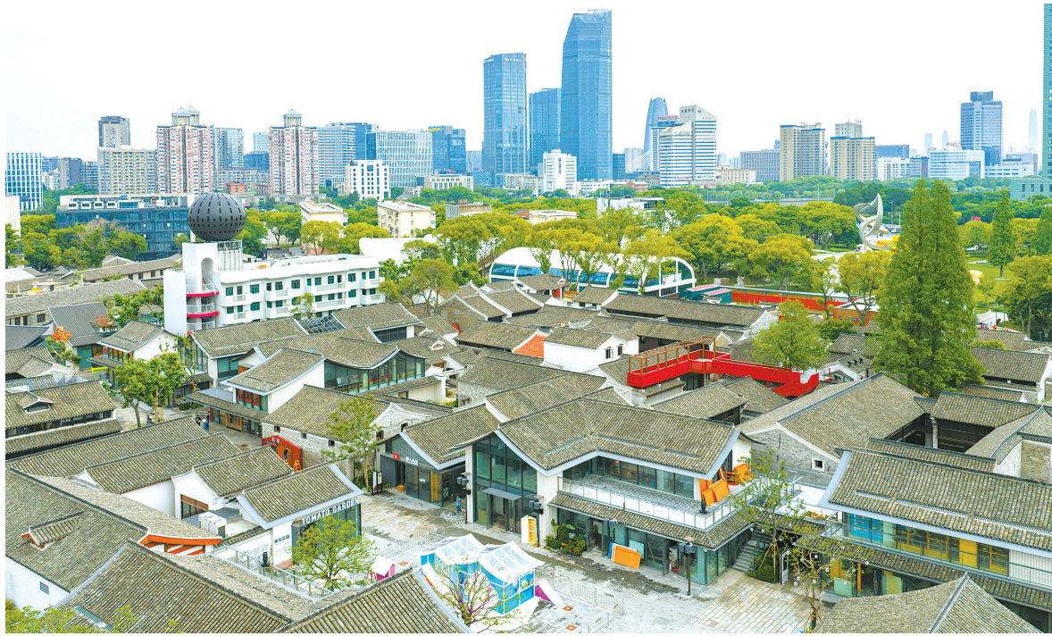
秀水历史文化街区。

作为宁波老城区底蕴深厚、留存完整的千年街巷，秀水街文脉绵长，与唐代明州罗城同源相生，见证了甬城千年城市变迁与市井烟火。街区留存大量明清至民国时期