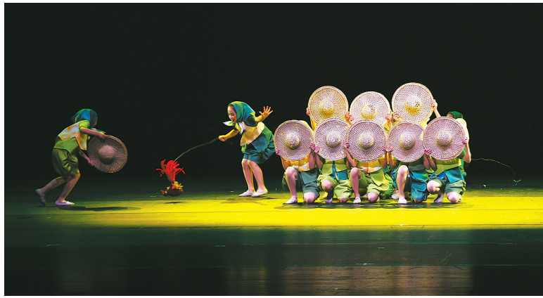
第十二届“小荷风采”全国少儿舞蹈展演。

2023年盛夏，“盛世修典——中国历代绘画大系”成果展·宁波特展“横空出世”。1600余件历代绘画精品出版打样稿，以“薪火相传 代代守护”“千古丹青寰宇共宝”“创新转化 无界之境”“舶交海上 墨韵东传”四大板块，在宁波美术馆铺开了一幅绵延千年的中华文明长卷。据统计，