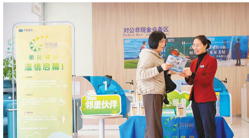
兴业银行宁波分行“兴公益”惠民驿站是各网点的标准配置，成为传递金融温度、践行社会责任的生动窗口。