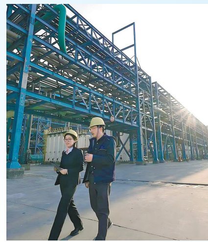
兴业银行宁波分行落地石化行业“可持续发展挂钩贷款”。

如果说创新是引领发展的新引擎，那么改革就是必不可少的点火器。近年来，兴业银行宁波分行坚持以改革开路破题，“刀刃向内”推进改革。推进重点领域组织架构调整，完善国际业务经营体制，优化零售经营体系，理顺消保组织架构，推进风险条线体制机制改革，落实重点领域提级经营，搭建起支撑高质量发展的“四梁八柱”，有效破解发展中遇到的难题。