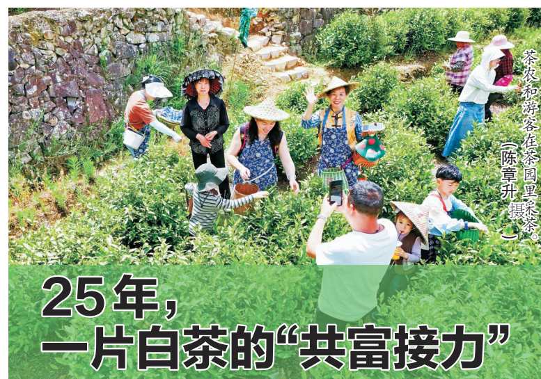
记者 陈章升 通讯员 郭丹盛 景士杰

观景等需求。 作为亚运会帆船赛事的重要配套保障道路,亚帆公路不仅完成赛事服务任务,还串联起沿线渔村、沙滩、景区与民宿资源,带动乡村旅游、运动休闲、特色餐饮等业态蓬勃发展。 “骑行友好路”,指的是线路好骑、安全有底、配套完善、服务到位、标识清晰的公路。 图为象山亚帆公路。