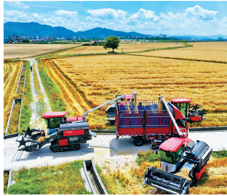
眼下，宁海县长街镇3.8万亩小麦陆续进入收割期，当地麦农有序开展机械化作业，确保颗粒归仓。