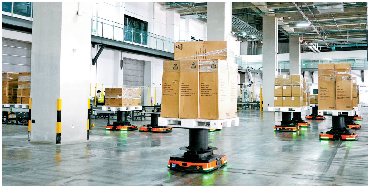
在百捷临港出口拼箱仓库装箱平台内，自动运输车有序运输货物。

数据显示，今年前4个月，宁波向塞尔维亚出口机电产品5.2亿元，同比增长3.7%。其中，出口自动数据处理设备及其零部件