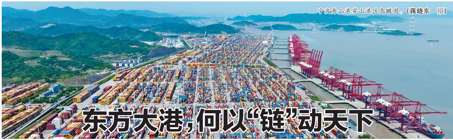
宁波舟山港穿山港区鸟瞰图。