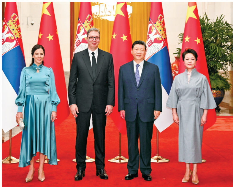
5月25日下午，国家主席习近平在北京人民大会堂同来华进行国事访问的塞尔维亚总统武契奇举行会谈。这是会谈前，习近平和夫人彭丽媛同武契奇和夫人塔玛拉合影。

新华社北京5月25日电（记者杨依军）5月25日下午，国家主席习近平在北京人民大会堂同来华进行国事访问的塞尔维亚总统武契奇举行会谈。