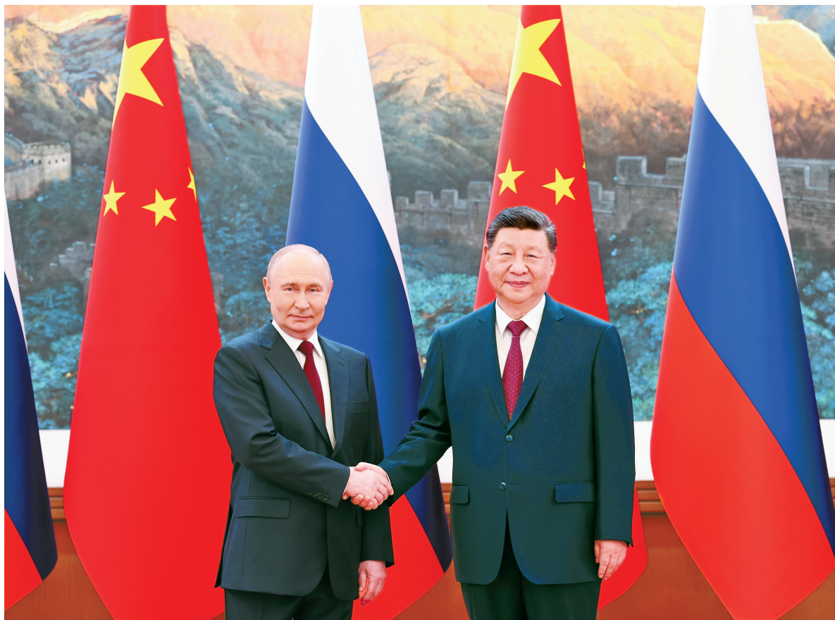
5月20日上午，国家主席习近平在北京人民大会堂同来华进行国事访问的俄罗斯总统普京举行会谈。会谈后，习近平在人民大会堂东门外广场为普京举行欢迎仪式。