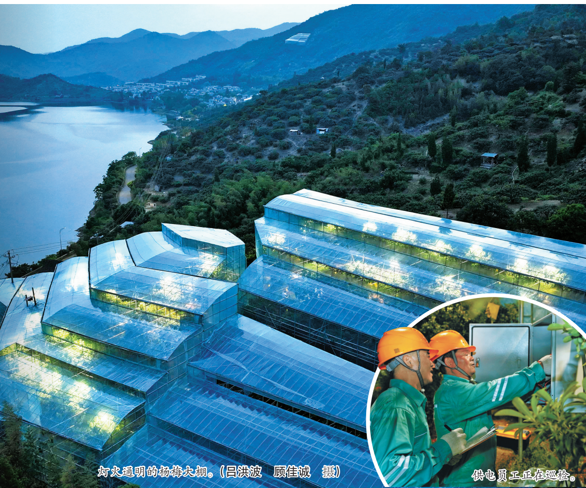
灯火通明的杨梅大棚。

本报讯(记者顾佳诚 通讯员吕洪波 苗云梦)前晚7时，位于余姚三七市镇唐李张村的杨梅大棚灯火通明。在梅农张赞的大棚内，国网余姚市供电公司文亨供电所的员工开展了一场夜间保电特巡。 张赞先后投入270余万元，搭建50亩采用“双膜双增温”技术的促成保温大棚，并利用空气能热风机、地暖管道和补光系统精准调控温度和湿度。这套技术不仅让大棚杨梅的成熟期比露天杨梅提前了40多天，更将亩产值提高至近10万元。 张赞介绍：“整套设备一启动就是连续十几个小时，最怕用电出问题。供电员工帮我们线路维护好，我的心里才踏实。” 随着电气化设备不断增多，杨梅大棚成了村里的用电“大户”，尤其是夜间补光和温控全开时，瞬时负荷极高。文亨供电所主动将服务关口前移，特意选择在晚上用电高峰时段上门“把脉”，重点排查高负荷线路的发热情况。