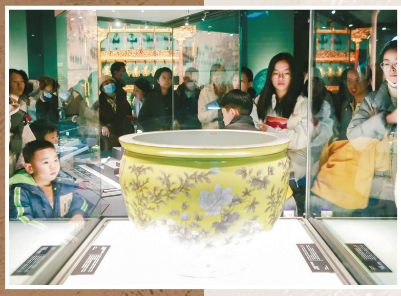
参观“紫禁韶华——清宫文物宁波贺岁展”