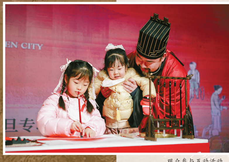
观众参与互动活动