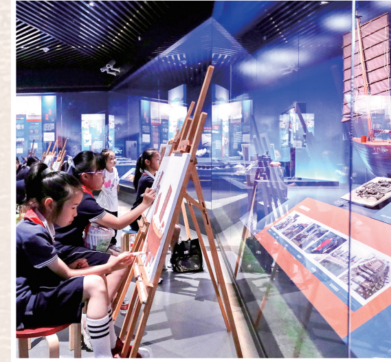
孩子们在中国港口博物馆内画画

当博物馆从“等客上门”到“主动上门”，从“高冷殿堂”到“烟火街巷”，其角色正在发生根本性转变。这不仅是物理空间的拓展，更是服务理念的重塑。未来，宁波将持续推动优质文化资源向基层延伸，搭建起博物馆与公众之间更紧密的桥梁，让市民能在家门口享受高品质的文化滋养。