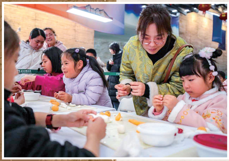
元宵带孩子们在宁波博物馆包汤圆