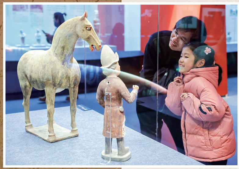
参观“东方的起点”特展