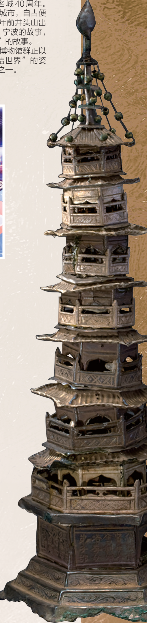
南宋绍兴十四年铭铁塔

未来，围绕“博物馆：联结世界的桥梁”这一主题，立足历史文化名城的深厚底蕴，宁波博物馆群将继续坚守文脉传承、深耕科技赋能、做实文化惠民、深化文明互鉴，让这座“联结世界的桥梁”更加坚固、更加宽广，书写新的时代命题下宁波的文博答卷。