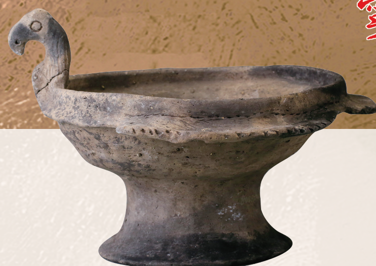
新石器时代河姆渡文化陶器

今天，国际博物馆日如约而至。今年恰逢国际博物馆协会成立80周年，国际博物馆日的主题定为“博物馆：联结世界的桥梁”。这一主题既回顾了博物馆行业八十载的坚守与深耕，也为当下分歧与隔阂并存的世界，指明了一条以文化为纽带、以理解为底色的前行之路。