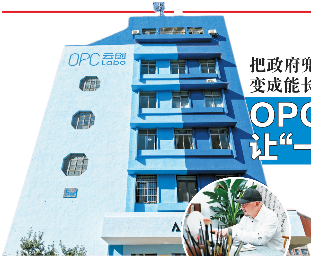
▲位于海曙区白云街道的AIOPC社区。