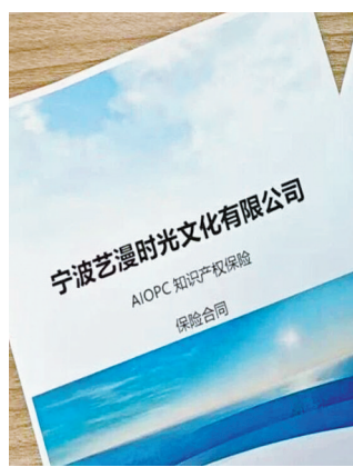
保险合同。

不过，记者在走访中了解到，目前OPC保险还存在种类较为单一、企业知晓度不高等问题。要让该类险种匹配不同需求、惠及更多企业，宁波应如何进一步创新？