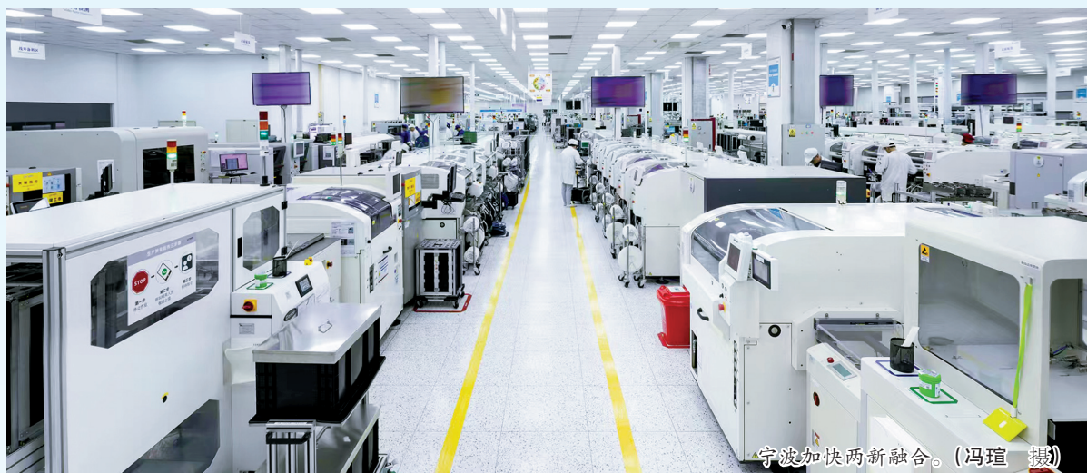
宁波加快两新融合。

制造业底盘扎实、产业集群完备，单项冠军企业数量领跑全国，这是其他城市难以复制、无法替代的核心底气。