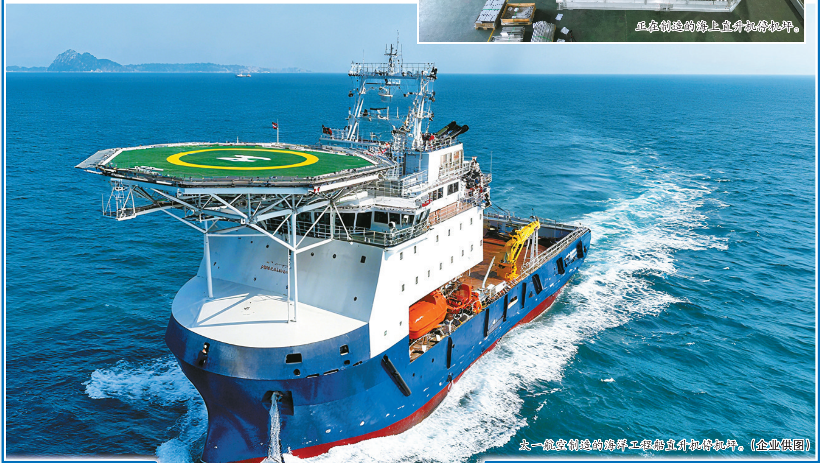
太一航空制造的海洋工程船直升机停机坪。