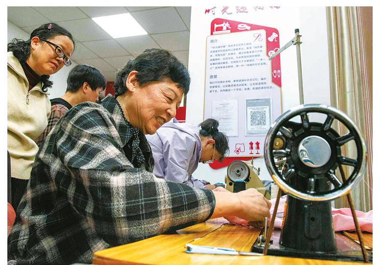
志愿者在为居民服务。