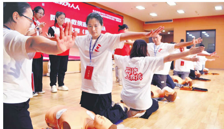
北仑区新碶街道开展“急救侠”队伍急救技能比赛。

本报讯(记者陈敏 通讯员陆窈)今天是第79个“世界红十字日”。记者从宁波市红十字会获悉，截至目前，宁波全市已有1654个村(社区)组建“急救侠”队伍，急救志愿者达9517名。一张全域覆盖的应急救援网络正加速织就，它将“黄金四分钟”的生命守护，无声地辐射至宁波的每一个角落。 “急救侠”是经专业培训的红十字应急救护员，自愿扎根基层，在突发事件中第一时间施救。“急救侠”队伍涵盖医护、教师、网格员、外卖骑手等不同职业。据了解，“急救侠”队伍建设已被纳入2026年宁波市民生实事项目，按计划，到今年底，全市2913个村(社区)将实现“急救侠”队伍全覆盖，“急救侠”总数将超过1.45万名。 作为浙江省首批“急救侠模式”试点地区，海曙、北仑两区已于去年底实现“急救侠”村(社区)全覆盖，共建立村(社区)“急救侠”队伍523支，招募“急救侠”3150人。 海曙的“急救侠”多次在关键时刻挺身而出：鄞江镇陈贤者等人施救溺水者、南门街道樊晓东救助晕倒居民、段塘街道小吴救援外籍幼童、古林镇戴老师联合护士救助倒地夜跑者……每一次救援，都是“急救侠”们用专业与勇气，守护生命的生动写照。