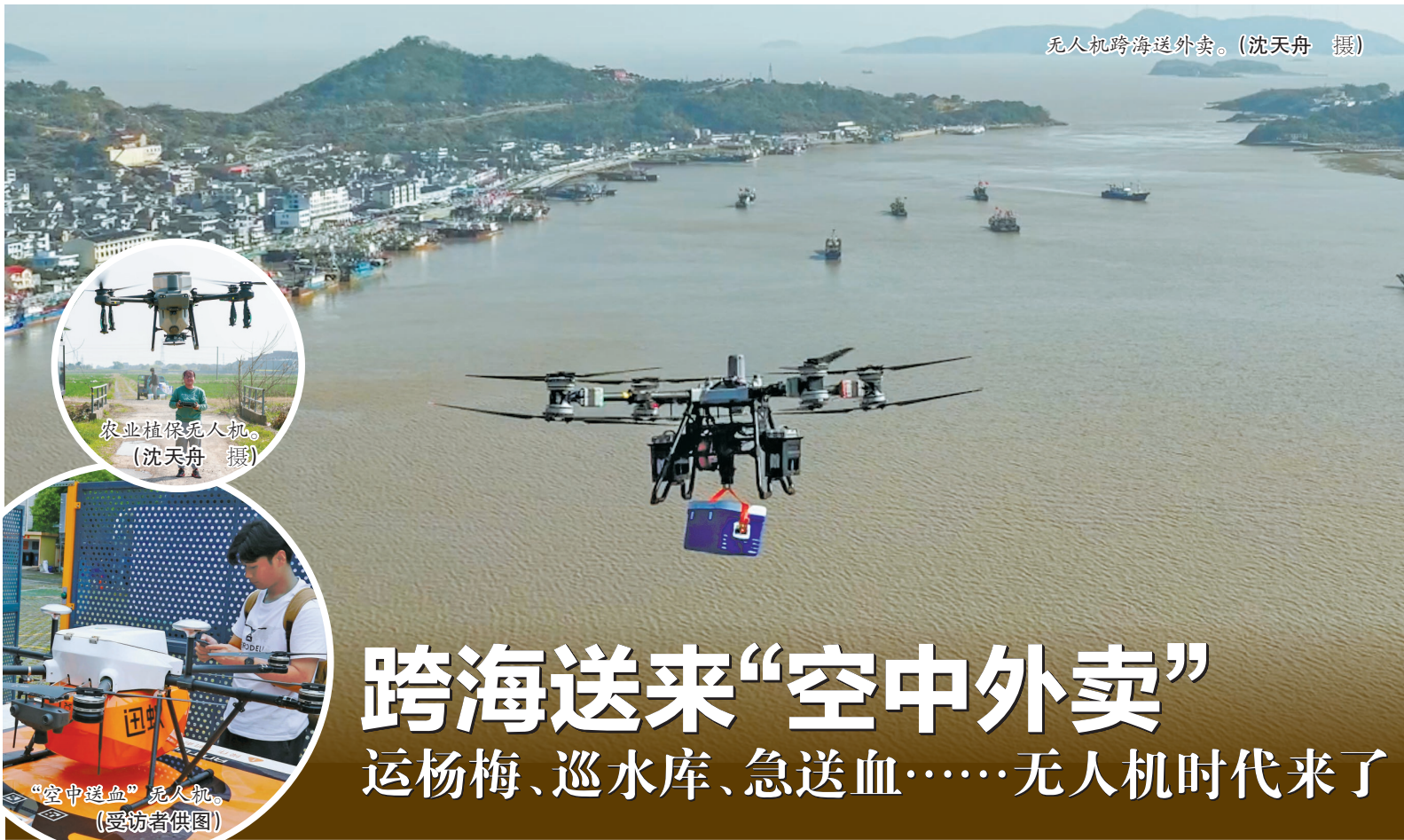
无人机跨海送外卖。