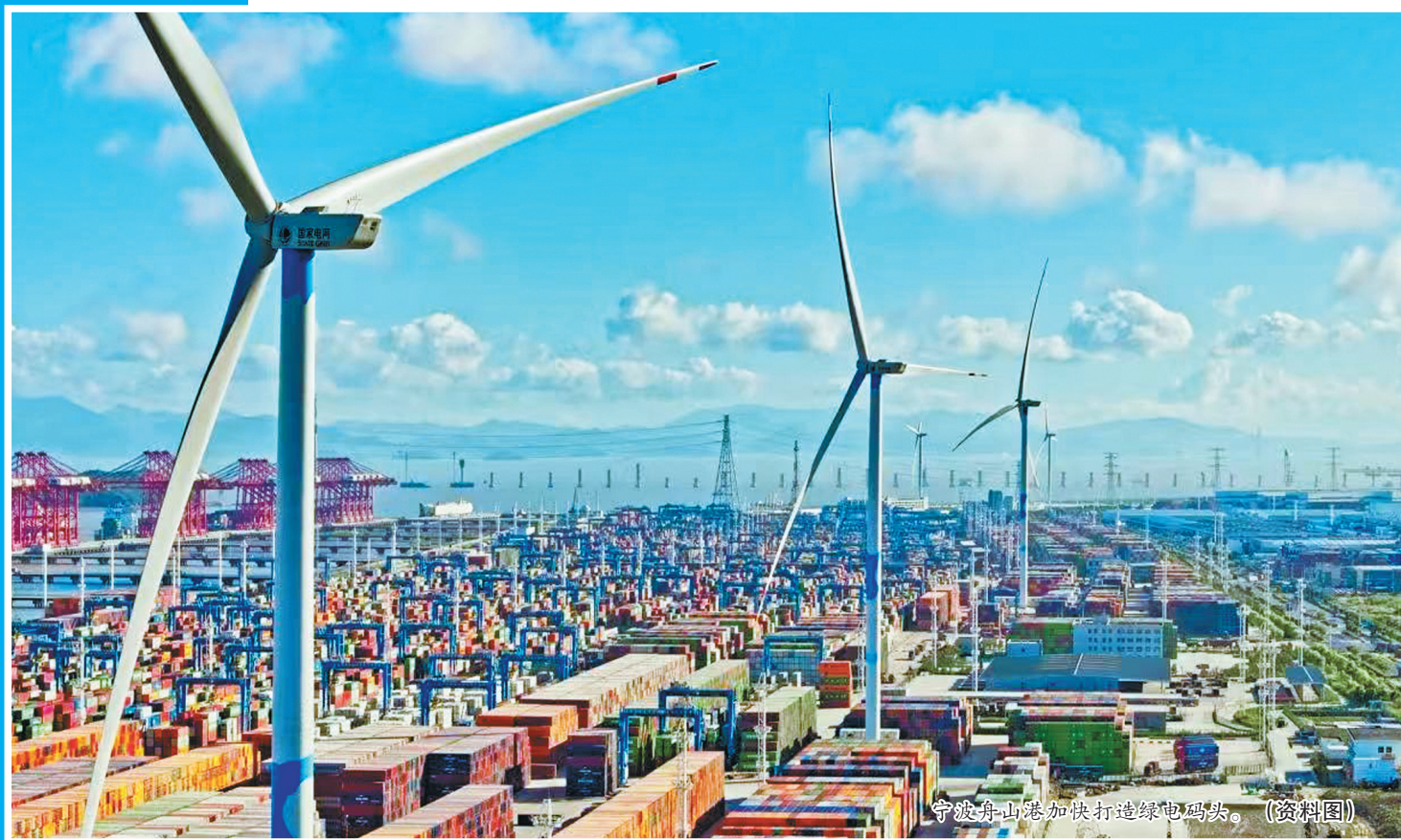
宁波舟山港加快打造绿色码头。(资料图)

昨日下午，上海合作组织绿色和可持续发展论坛三大分论坛在宁波同步举办，围绕“绿色合作促进全球可持续发展”“多元共治保护全球生物多样性”“科技创新推动发展绿色转型”三大议题，中外嘉宾齐聚一堂、共话机遇、共享经验。