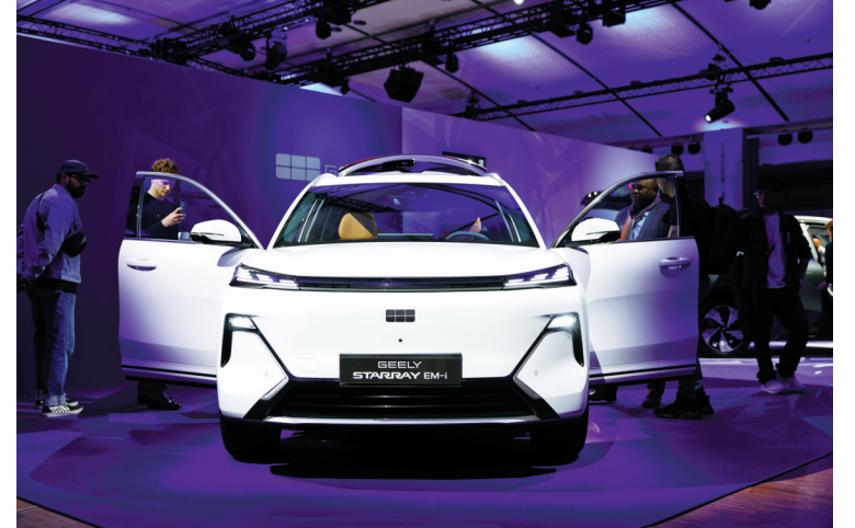
4月28日,在法国巴黎,人们参观吉利Starry EM-i电动汽车。当日,中国车企吉利在法国巴黎举行活动,宣布两款电动汽车在法上市。