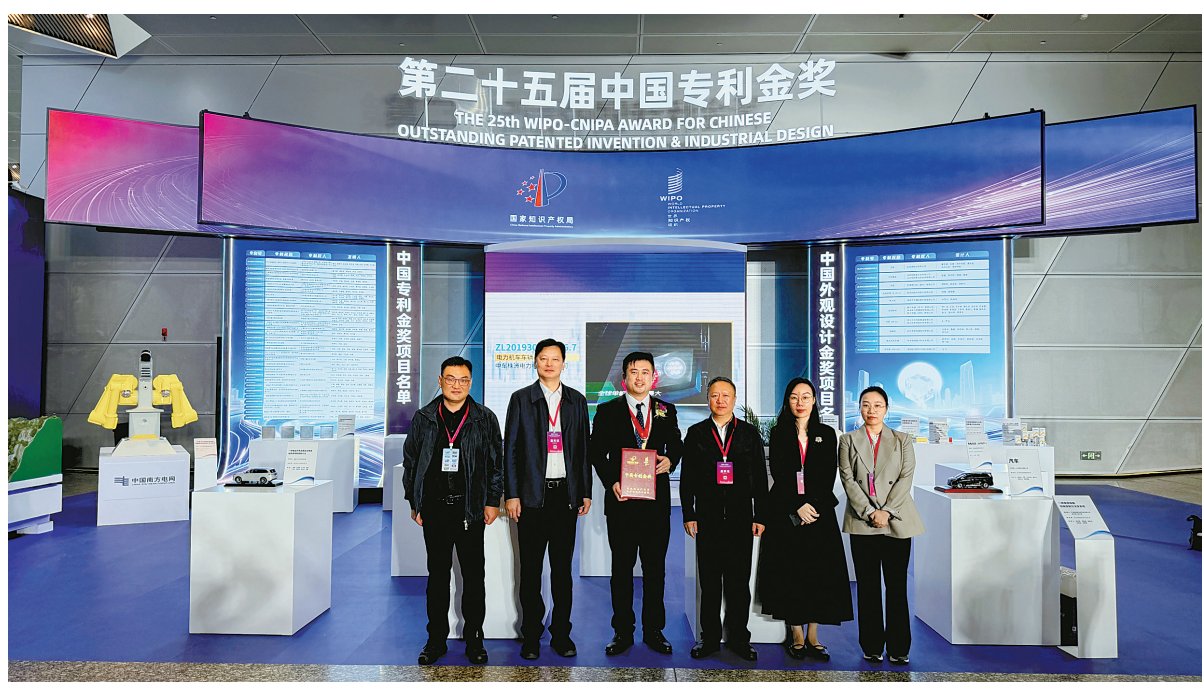
宁波新获第二十五届中国专利奖“双金奖”。

组建由北京大学、中国社会科学院等机构的12名顶尖专家构成的高端智库，为知识产权战略决策提供强有力的智力支撑。建设宁波知识产权学院（设在浙江万里学院），建成国家级知识产权培训基地11个。持续加强人才引育，“十四五”以来新增知识产权师145人。设立服务业（知识产权）人才专项。深化“校（院）企双聘”机制，累计选聘“科技副总”244名、“产业教授”286名。实施“伙伴优选”行动，为知识产权人才创新创业提供全周期服务。