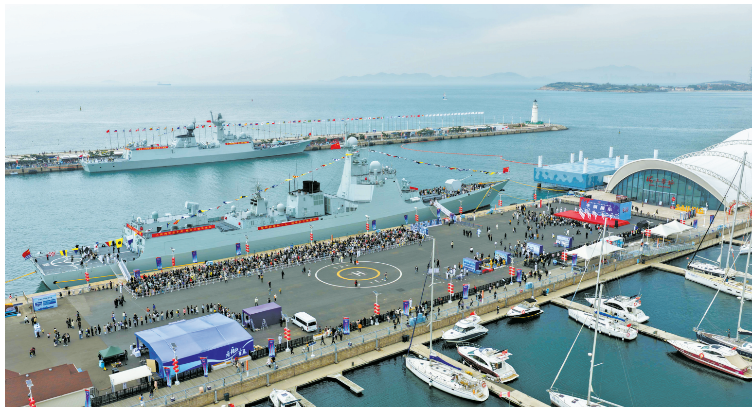
4月23日，海军乌鲁木齐舰、潍坊舰在青岛奥帆中心码头面向公众开放（无人机照片）。

织多处军港和军营开放活动。民众走进宁波、上海等地海军军港，与空警-500H、运-8、运-9、直-9D等现役主战机型近距离接触。 与此同时，大连、南京、舟山、三亚等数十个大中城市以高楼大厦为画布、光影科技为画笔，用“城市灯光秀”点亮中心商圈、古城城墙和交通枢纽，通过楼宇电子屏、移动电视等平台，播放人民海军系列宣传片和海报。