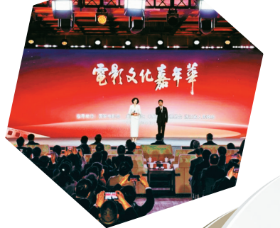
电影文化嘉年华现场。