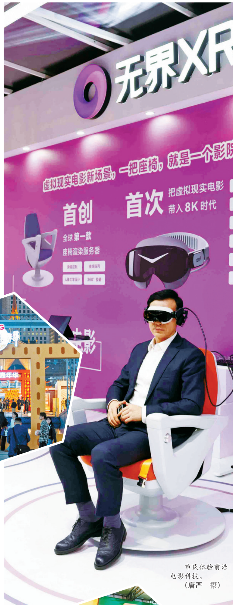
市民体验前沿电影科技。

深耕十余载的北纬30°短片周，已成长为亚洲影坛较有影响力的短片孵化平台，众多青年电影人从这里走向更广阔的舞台，也为2026“长三角国际青年电影节”的落地提供了成熟的运营经验和专业团队。