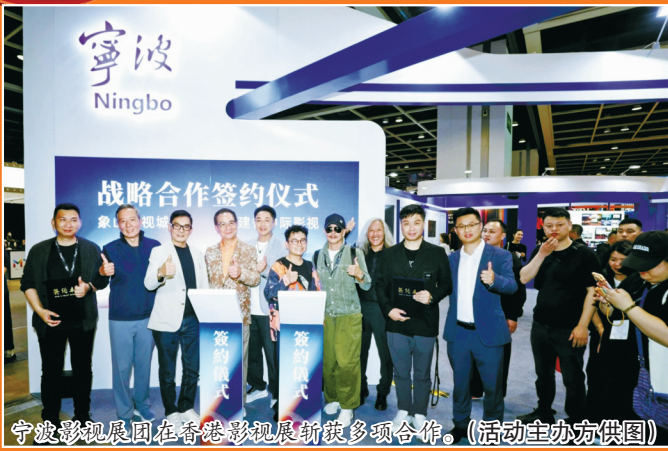
宁波影视集团在香港澳门影视展等多项合作。

日前，由国家电影局指导、中央广播电视总台与浙江省人民政府联合主办的电影文化嘉年华在宁波成功举办。