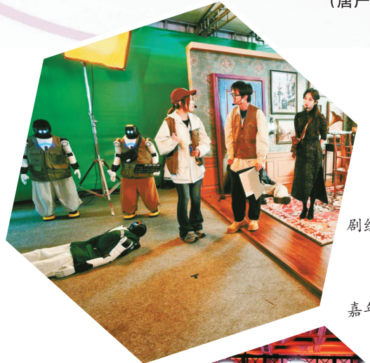
机器人在剧组“打工”。