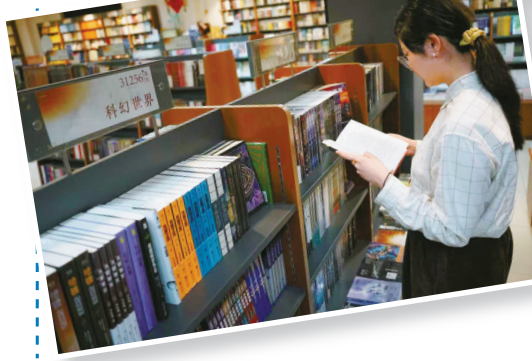
在宁波书城和鄞州书城科幻文学专柜，为自己挑选一个未来的入口。