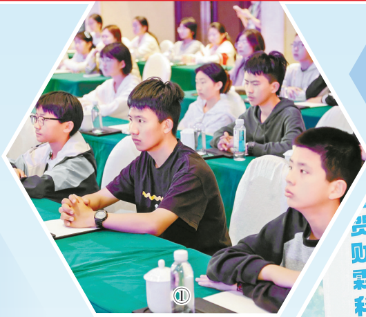
①第五届“贺财霖科幻文学奖”颁奖典礼现场。

站在新的起点，这份源于东海之滨的科幻力量，正期待更多社会力量与政府政策的支持，希望继续以文学之笔探索未来边界，以科幻之光点亮城市精神，为中国科幻文学的繁荣发展注入源源不断的“宁波动力”，在时代浪潮中书写属于宁波、属于中国科幻的崭新篇章。