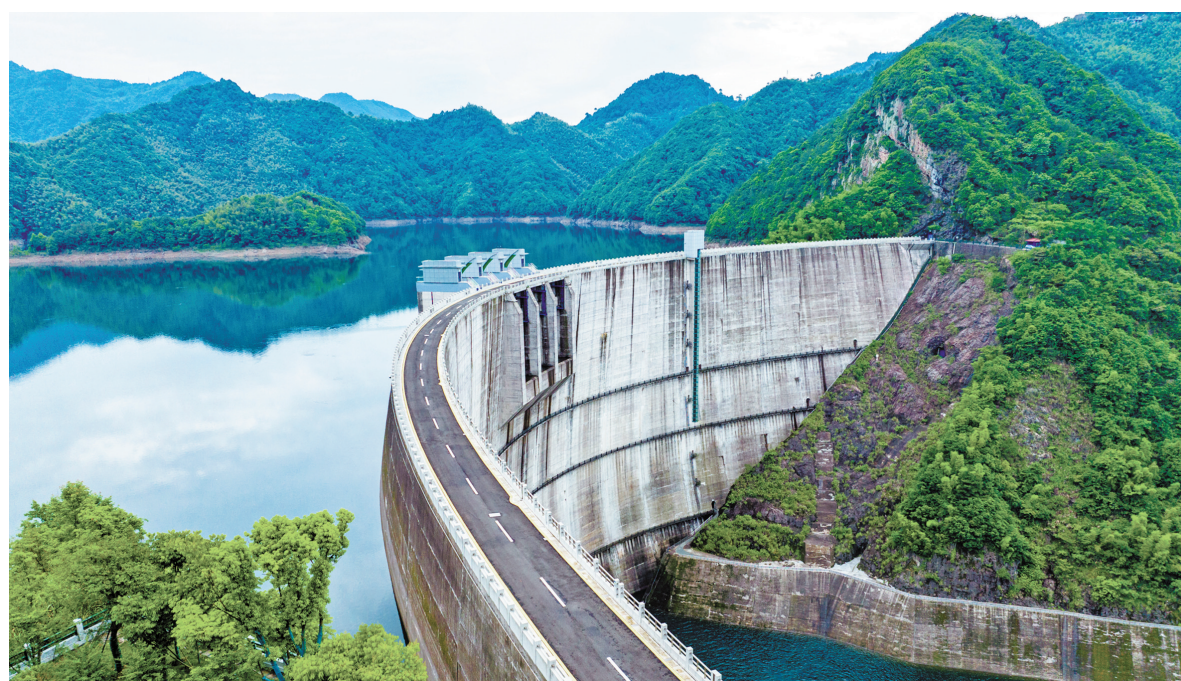
全市大中型水库蓄水量较常年同期偏少。图为周公宅水库。