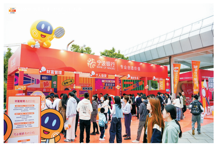
赛事嘉年华体验区。(组委会供图)