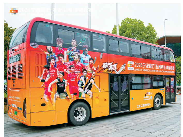
双层观赛接驳巴士。(组委会供图)