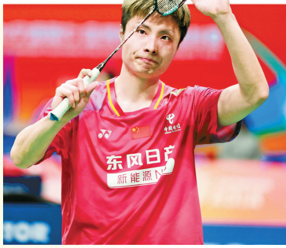
石宇奇在赛后向观众致意。