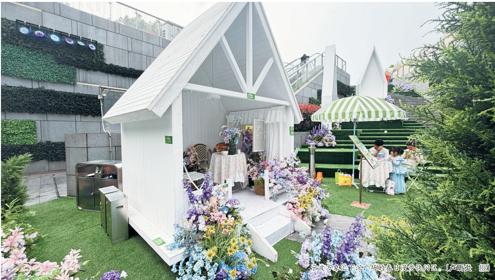
宁波万象汇下沉广场的春日漫步快闪店。