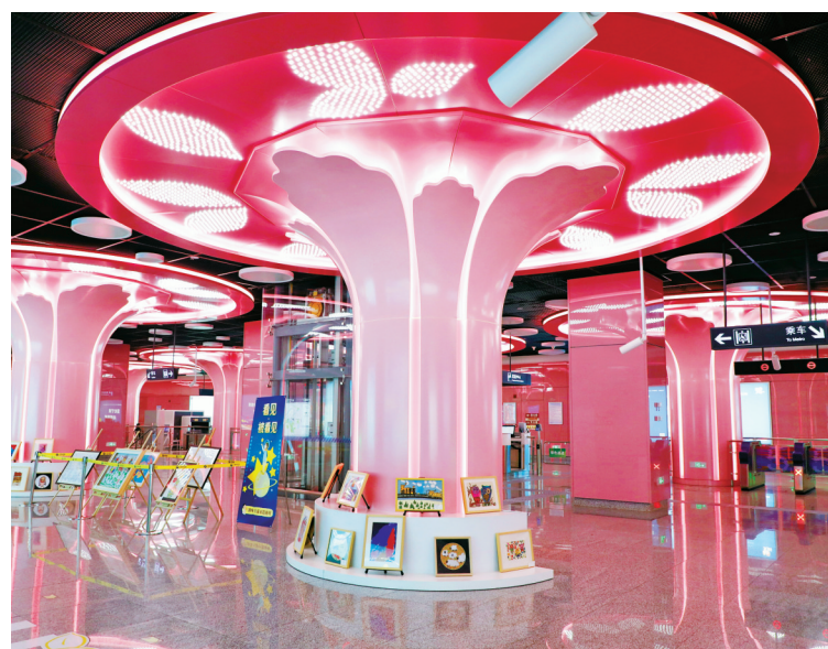
焕然一新的地铁站。