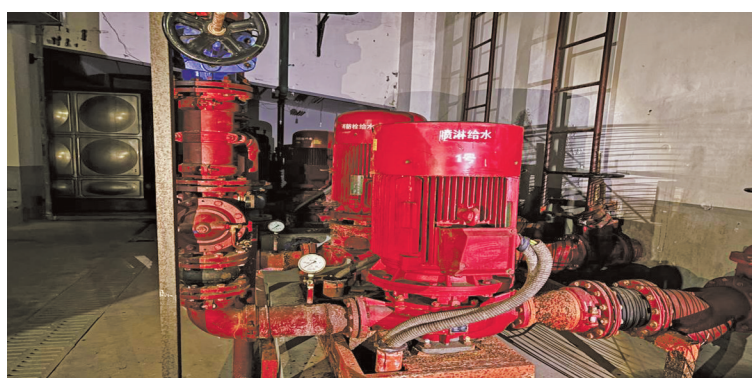
喷淋泵出现故障，无法正常联动启动。

世纪东苑公寓位于鄞州区潘火街道环城南路东段1678号，是一个商住楼宇，之前由宁波永成物业管理有限公司管理。2025年10月起，由宁波鑫正城市服务有限公司接手管理。