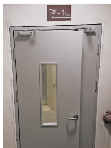
小区更换了防火门。

高新区消防救援大队工作人员徐俊介绍，之前整个小区的火灾自动报警系统、消防供水系统、自动喷水灭火系统、消火栓系统均不能正常运行，安全隐患问题严重。4月7日，记者跟随高新区消防救援大队人员到该小区查