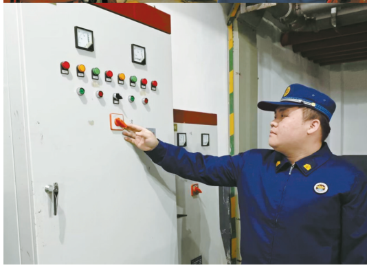
消防人员核查消防水泵和控制柜运行情况。