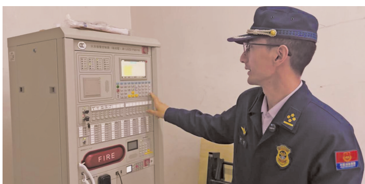
火灾自动报警系统得到修复。