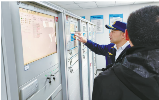
金辉街消防系统已实现正常运行。消防人员正对主机进行调试机查。

前湾新区世纪城金辉街商业街东街，隶属陆中湾街道清鹭社区，街区东至罗源路、西至芦汀路、南至连江路，现有商铺106户，涵盖餐饮、超市、美容美发等多元业态，由世纪金源宁波物业公司负责管理。该商业街总建筑面积约1.12万平方米，于2012年11月建成投用，主体为两层钢筋混凝土结构建筑。