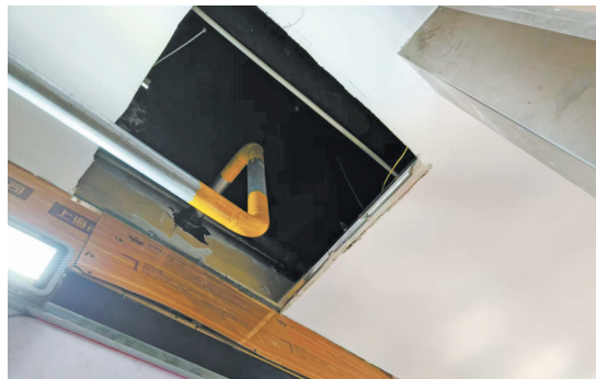
部分店内烟感探测器、灭火喷头消防设施因装被密封包裹在吊顶内部，有待整改。

“前期排查发现，街区存在多处突出火灾隐患：火灾自动报警系统、自动灭火系统无法正常运行，消防车通道屡被占用，电