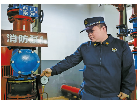
消防人员核查消防水泵和控制柜运行情况。

宁海县消防救援局有关负责人告诉记者，整改完成后，监管部门将持续压实责任主体的安全责任，进一步筑牢小区消防安全防线。