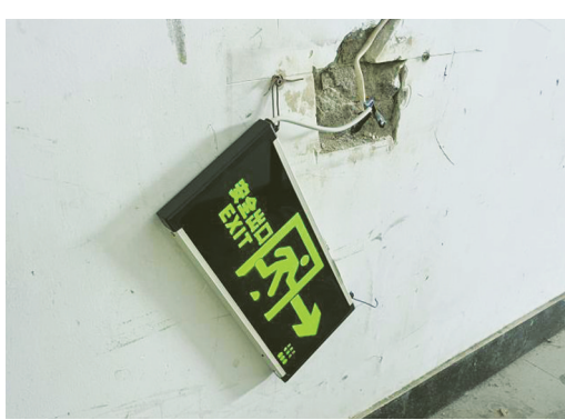
安全出口标识脱落。