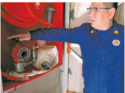
消火栓不出水。

奉化区消防救援局相关负责人介绍，要消除小区消防安全隐患，必须做好日常维护，对有故障的设施，该修的就修，该换的就要换。现在，小区业委会也在积极想办法，准备引入新的物业公司加强管理。针对维修资金缺乏的情况，消防救援部门也对接了奉化区住建局，帮小区争取一部分专项维修经费。“我们会跟进督导，帮助小区尽快排除设施故障，按计划完成年度整改任务。”该负责人表示。