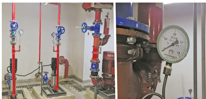
地下消防水池管道无水，水压为零。

位于奉化区弥勒大道的世茂桃园二期小区，是2023年3月交付投用的新小区。由于日常维护不到位，小区很多消防设施处于无法使用的状态，安全隐患问题突出。