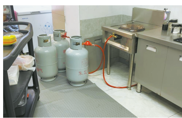
楼层商户违规使用瓶装液化气。

险。绿叶大厦位于象山县丹东街道，建成于上世纪90年代末，颇为老旧，是一座纯商务写字楼。大厦内业态较为复杂，有商务办公、棋牌室、台球房、出租公寓等，且没有统一的物业管理公司，管理较为混乱。