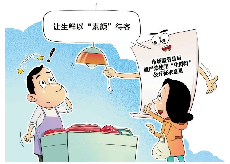
漫画角 不得“美颜” 王琪 绘

招商引资不是“数字竞赛”,而是一场关乎发展质量的“持久战”。河南的造假事件,是形式主义侵蚀基层工作的典型案例,更是对所有基层干部的警示。唯有破除形式主义、官僚主义,坚守实事求是底线,让考核回归实效、工作回归本真,才能让招商引资真正成为推动区域发展的引擎,让每一份投入都能转化为实实在在的发展成果。