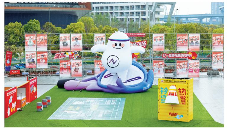
赛事嘉年华体验区。