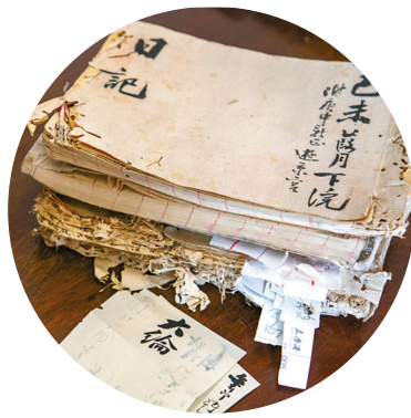
百年前的日记本。

为保障供应,叮咚买菜今年累计上架260款时令商品,其中春菜125种、水产130余种,并推出海鲜菜头、南瓜花、骆马湖一鲜等特色单品,通过产地直供、品种优化及供应链升级,确保春鲜产品稳定上架、持续热销。