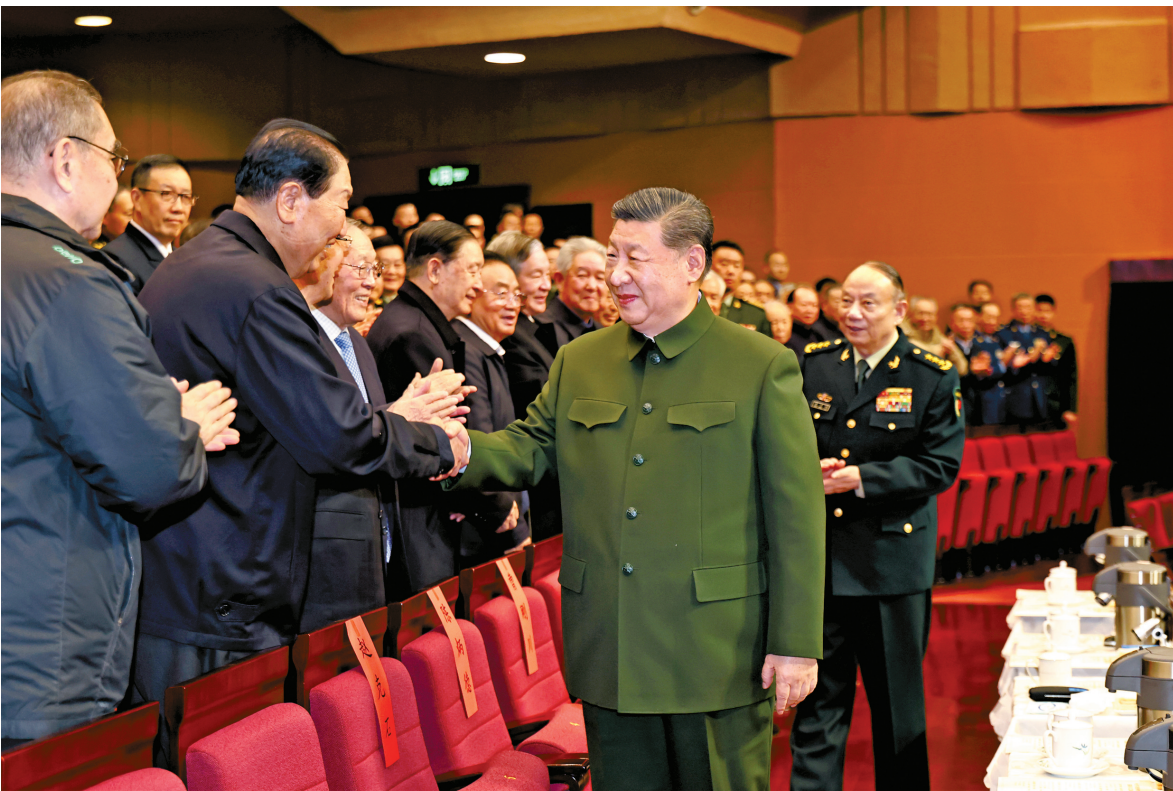
2月6日下午，中央军委慰问驻京部队老干部迎新春文艺演出在中国剧院举行。

“旗帜领航，团结奋斗向前方！熔炉淬火，越锻造越坚强！”混声合唱《永远的荣光》以铿锵旋律拉开演出序幕。演出贯穿整训锻造焕新风、攻坚冲刺向百年的鲜明主题，突出展现政治建军新风貌、现代化建设新进展、备战打仗新成效，抒发全军官兵坚定维护核心、坚决听从指挥的共同心声。器乐与合唱《钢多气更