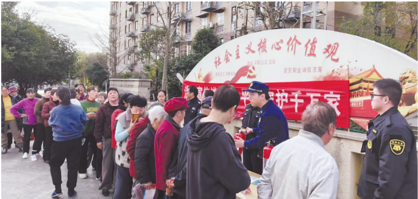
消防救援部门在银珠明园小区开展消防安全宣传。

农村中，民房堆放易燃物品、乱拉电线等安全隐患比较突出。宁海县力洋镇组织综合行政执法、应急管理、消防救援等部门，成立专项工作组，对力洋村老街86弄院落堆积的废旧物品进行清理，腾空院落，引导涉事废品回收人员到规范场所开展经营。此外，力洋镇还在全镇范围内对历史文化村落、老旧