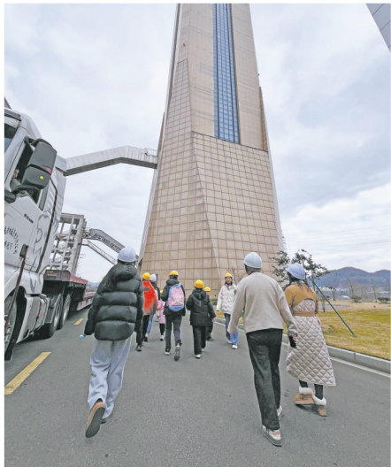
前往“网红电梯试验塔”乘梯。

今年，“小眼睛看大宁波”活动第三季开启。和前两季一样，所有活动为纯公益性质，不收取任何费用。爱心企业华茂教育为每一次体验活动提供资金支持。下一期活动即将推出，大家可关注甬派获取最新信息。