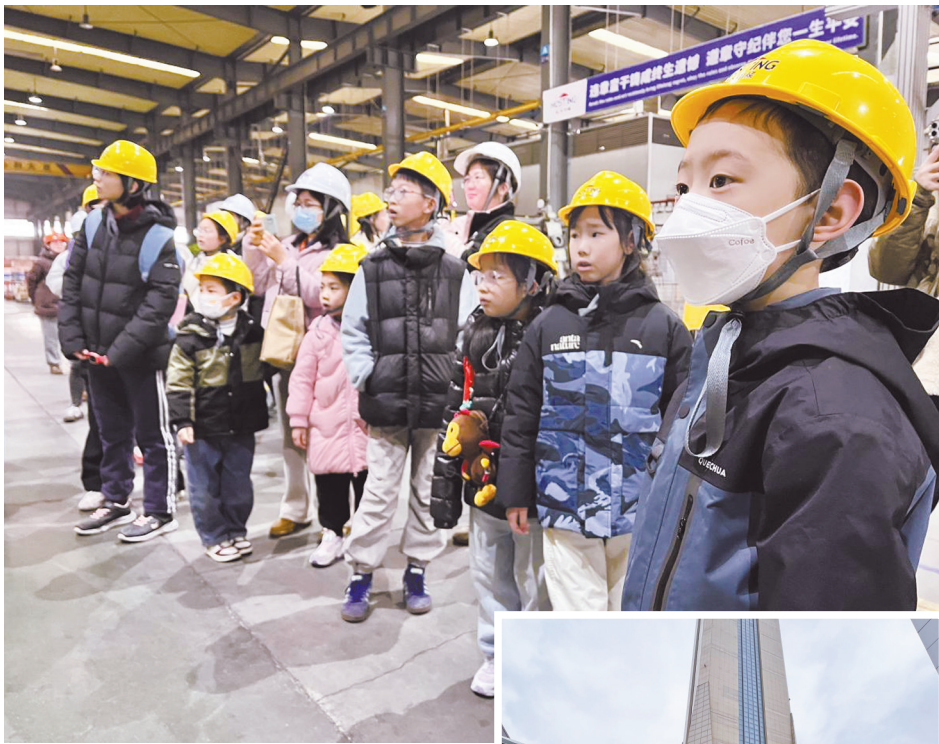
在车间参观。

第二季活动持续升级，探索版图进一步拓展。大家在宁波牛奶集团，见证鲜奶从牧场到餐桌的全制作流程；在余姚桃坎头村“红芯植物工厂”，感受现代农业与