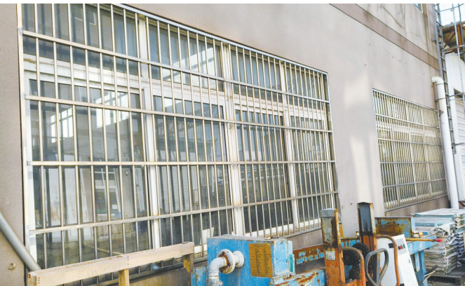
位于余姚市小曹城镇的宁波和磁科技有限公司生产车间安装了老式防盗窗，影响疏散。