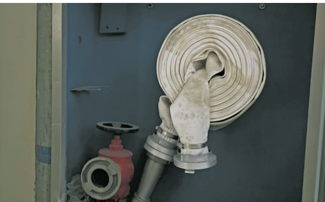
慈溪道林金龙针织服装厂园区消防水管没有进行双卷处理。