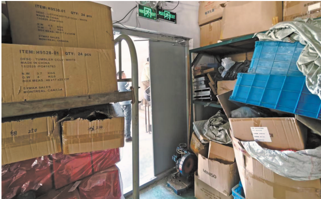
海曙古林的鄞奉模具氮化厂园区内一家机械厂在安全出口周边放置了大量易燃物品。

园区中个别企业对安全用电不够重视。检查中发现，一家钢材厂的电表箱下面外接了一只插线板，未安装地线。另一家石材加工厂的一只电焊机同样未外接地线。为此，检查人员向厂区安全员开具检查单并提出整改要求，对方表示会尽快处理。