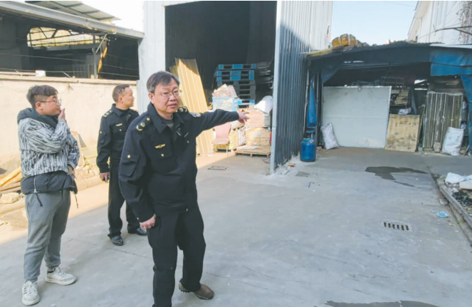
奉化西坞的宁波银满光电科技有限公司园区消防通道被墙体与堆放的杂物阻断。（余建文 摄）