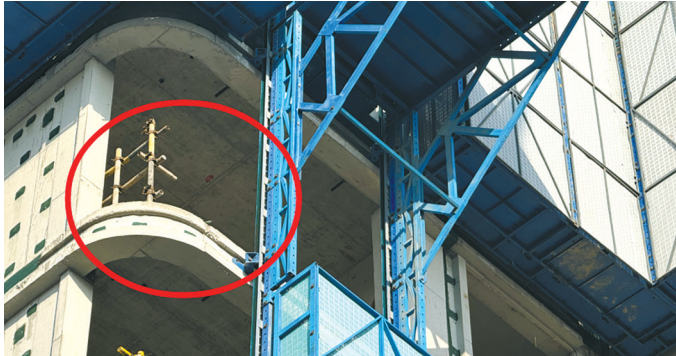
东部新城核心区以东片区A5#区块临边防护拆除后未及时恢复。