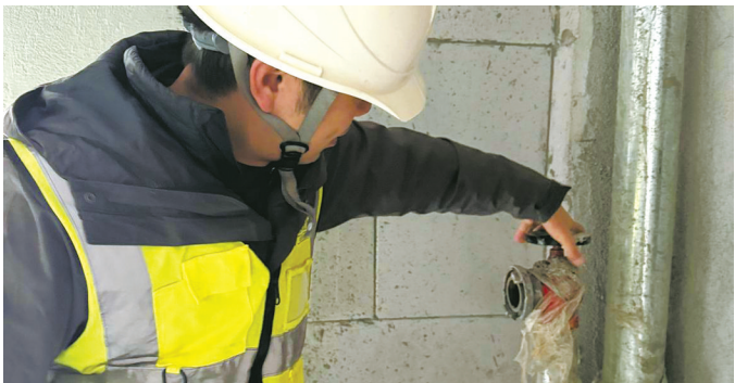
北仑区ZB02-03-06c-2#地块房产项目消防栓无法正常使用。