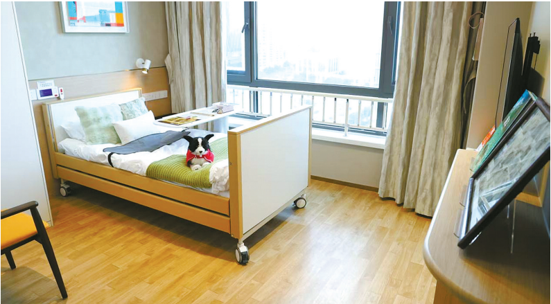
老人可免费入住的独立单间。