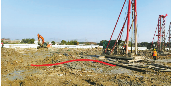
镇海区综合体育中心建设项目工地施工电线直接铺在泥地上。