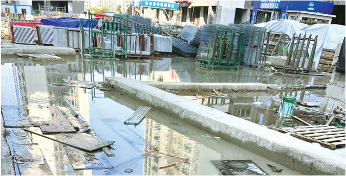
海曙区未来视界小区项目工地不少区域有积水。

本次走访聚焦建筑工地现场安全防护、高空作业防护以及临时用电等消防安全等问题。从走访检查看，建筑工地总体安全可控，工地环境卫生总体良好，但也存在设施防护、个人防护不到位，乱接电、消防设施配置不足等问题。本次报道通过揭示风险推动整改，督促各方压实责任，加强管理，切实筑牢工地安全防线。