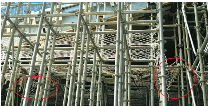
奥体中心地块(体育场)项目白色防坠网破损。