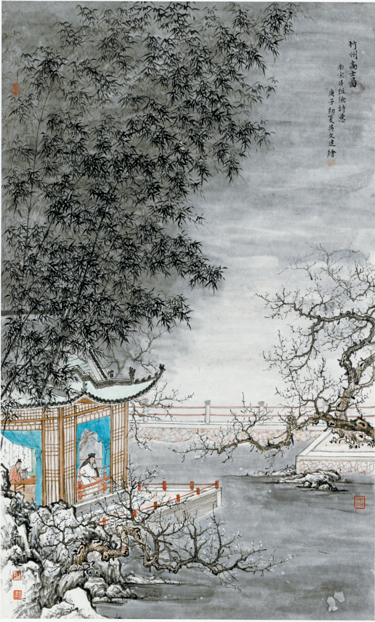
当代画家吴文建《竹洲高士图》描绘了宋代月湖竹洲高士雅集的场景。