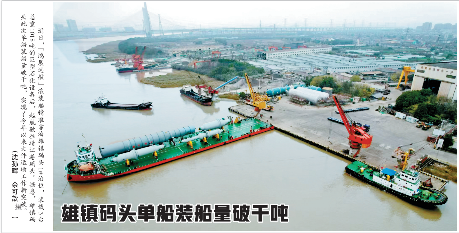
近日，“鸿展远航”滚装船精准靠泊镇码头二#泊位，装载心台总重100吨的巨型石化设备后，起航驶往靖江港码头。据悉，镇码头此次单船装船量破千吨，实现了今年以来大件运输工作新突破。

转角可遇见绿意，抬步便能加入运动——一个个被激活的空间节点，正以“小而美”的织补手法，细腻绣出一幅宜居宜业、温暖可及的城镇新画卷。“从‘村民跑’到‘医疗跑’，从‘有场地’到‘优体验’，从一位难求到停车有序，我们努力把优质公共资源稳稳下沉到群众最需要的地方。”观海卫镇主要负责人说。