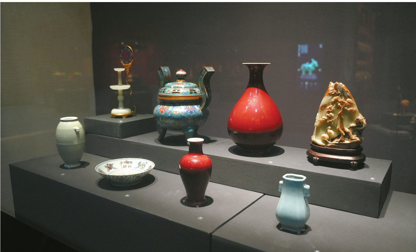
“紫禁韶华”展区一角（徐诚 摄）