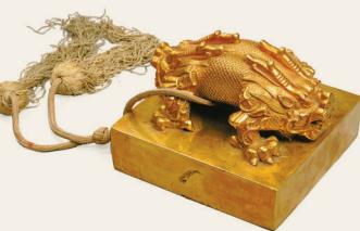
清 金龙钮“皇后之宝”（故宫博物院藏）