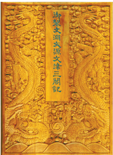
清 青玉御制《文溯文源文津三阁记》册（故宫博物院藏）

这已不仅是两场展览的并置，更是一座城市以开放之姿，架起联通东西方美学的精神桥梁。