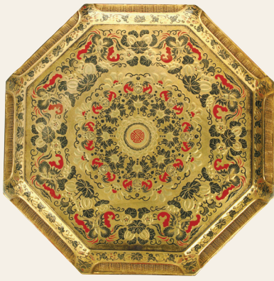
清 金漆画彩福寿纹镂空八方盒（天津博物馆藏）