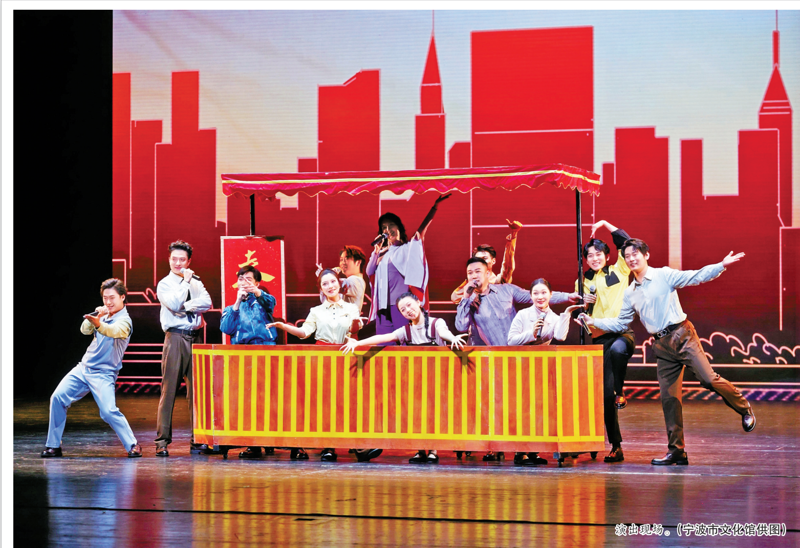
演出现场。

才需求配套“民商法治诊所”、跨境电商政策解读、国际读书会等个性化服务。 不仅如此,这里还专门设置了项目路演区、共享会客厅等多元空间,对接了创业孵化器、产学研平台等资源,足不出户为技术转化提供支撑。 如今,在眠牛山,人才公寓、体育场馆和大型商超共同构筑起“10分钟宜居圈”,美食节、音乐节、舞蹈赛等轮番登场,联手打造活力四射的“国际文化沙龙”。未来,这里还将联动经济开发区的光伏产业园、科技孵化园,打造“职住一体”的产城融合示范区。 宁海县委人才办相关负责人表示,当前,宁海人才总量已突破19.19万,高端人才数量连续4年增长。眠牛山国际人才社区将继续以“政府引导、国企运作、市场参与”模式,通过整合政策、资本与市场资源,积极构建“近悦远来”人才服务生态,成就更多人才与城市相互奔赴的美好故事。