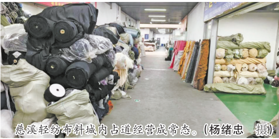
慈溪轻纺布料城内占道经营成常态。

慈溪轻纺布料城是一个现代化的专业布料交易市场，是胜山服装布料市场的升级版，于2022年5月开业。该市场开业以来，从硬件配置到智慧防控都搭建了较为完善的消防设施体系，且通过常态化整治与应急演练持续巩固消防安全防线。