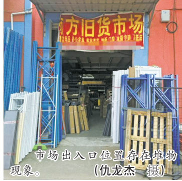
市场出入口位置存在堆物现象。