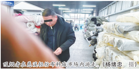
吸烟者在慈溪轻纺布料城市场内游走。