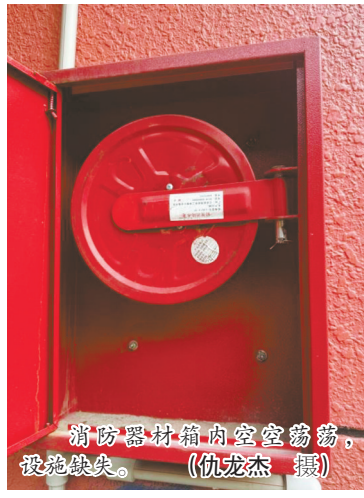
消防器材箱内空空荡荡，设施缺失。