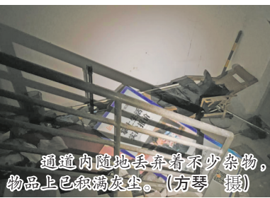
通道内随意丢弃着不少杂物，物品上已积满灰尘。