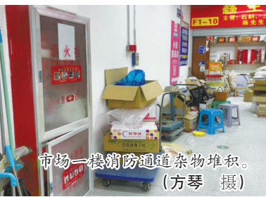
市场一楼消防通道杂物堆积。

新横石桥市场位于鄞州区兴宁商贸城内，一楼主营干货批发，二楼以经营服装布料为主。市场内消防设施配备齐全，各类消防设施检查卡能及时更新，不过，记者发现市场内仍存在多处消防安全隐患。