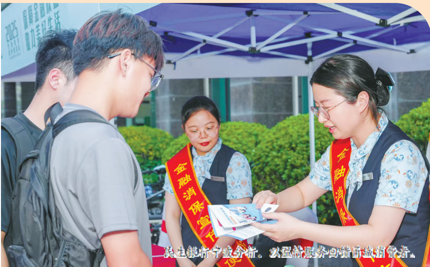
民生银行宁波分行，以民为本，服务实体经济高质量发展。

经营机构在服务小微企业服务过程中的“敢贷、愿贷”内生动力；持续创新，形成“能贷、会贷”的差异化金融服务。同时，积极联动政府、商协会、小微园区等，开展“千企万户大走访”专项行动，对接小微企业实际需求，推动落实小微企业融资协调工作机制，扩大普惠金融服务质效。