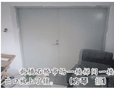
新横石桥市场一楼梯间一楼出口被上了锁。