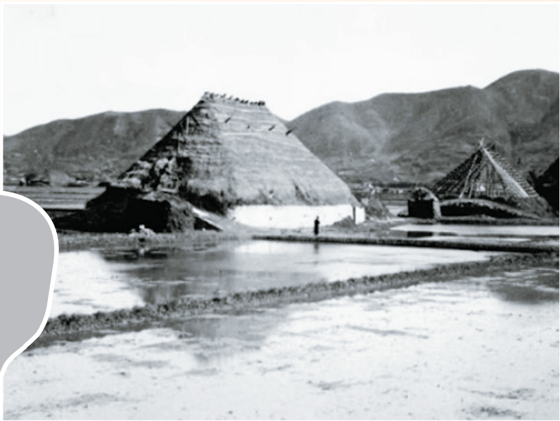
冰厂照片。