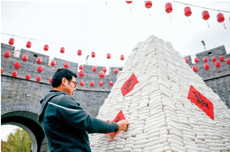
“年糕派对”热闹开场。