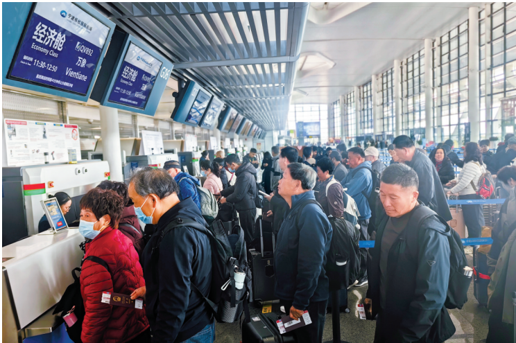
由宁波前往老挝万象的游客明显增加。