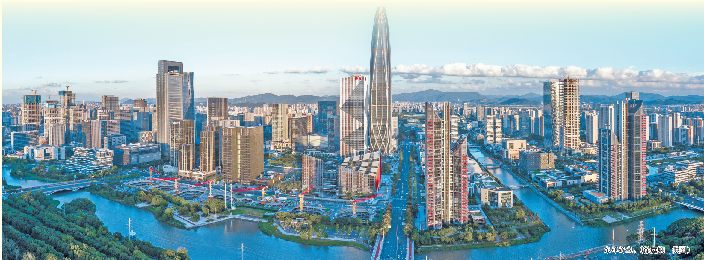
东部新城。