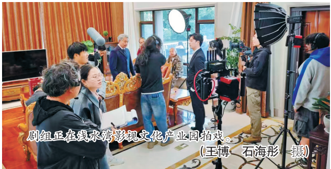
剧组正在浅水湾影视文化产业园拍戏。