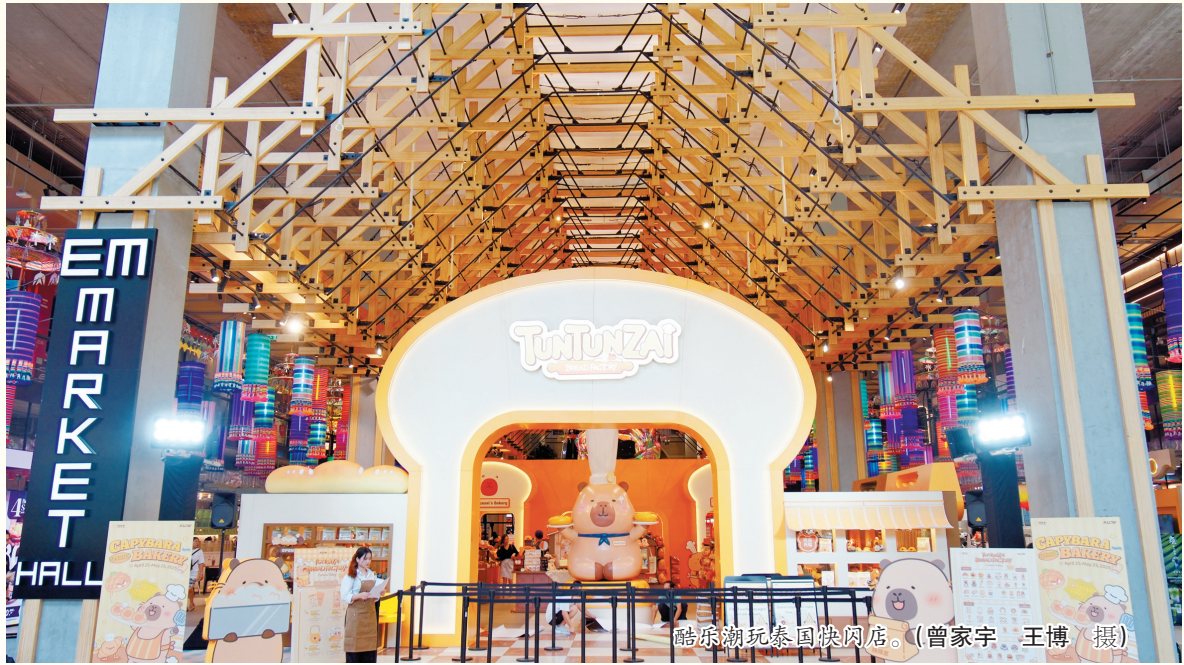
酷乐潮玩泰国快闪店。

值得一提的是，东部新城、南部商务区、东外滩三个省级现代服务业创新发展区以及宁波国家广告产业园、211文创园等产业平台已集聚一大批文化“新三样”企业及上下游关联企业，为行业持续发展注入源源不断的动力。