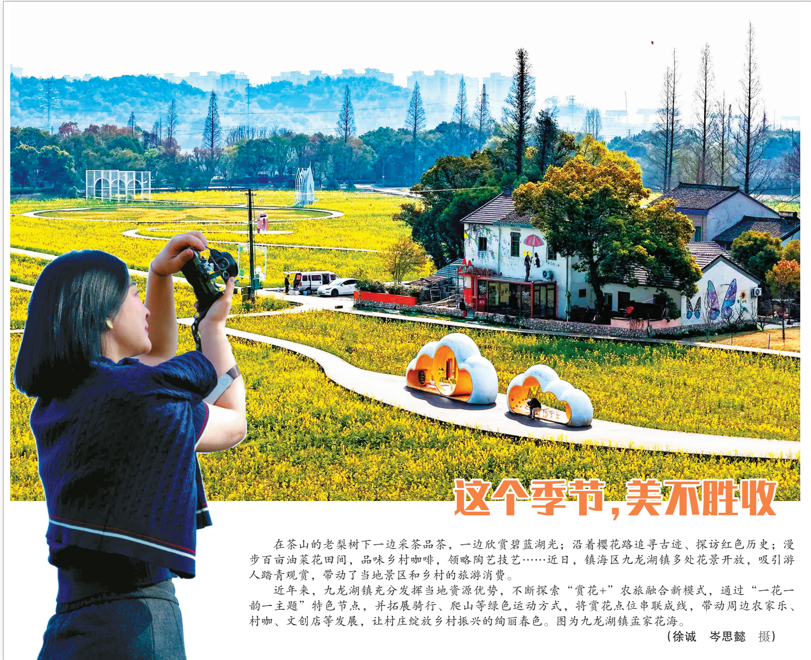
这个季节，美不胜收

禁渔还需要得到广大市民的支持和配合。执法人员要加强禁渔政策宣传引导，通过温馨提示、现场监督等多种形式，提升市民的知晓率和参与度，共同守护宁波内河的渔业资源，为构建美丽和谐的生态环境贡献力量。