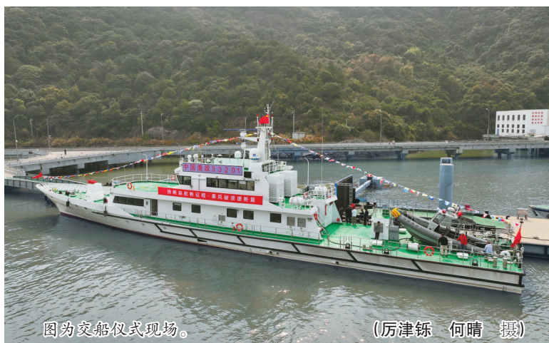
图为交船仪式现场。