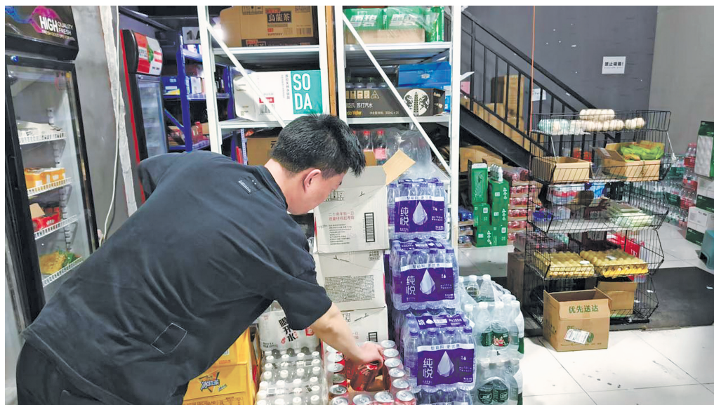
朱先生经营的小店。

一位市场监管部门工作人员向记者坦言，职业打假泛滥，给市场环境和相关部门日常管理带来不利影响，需要找到有效解法——