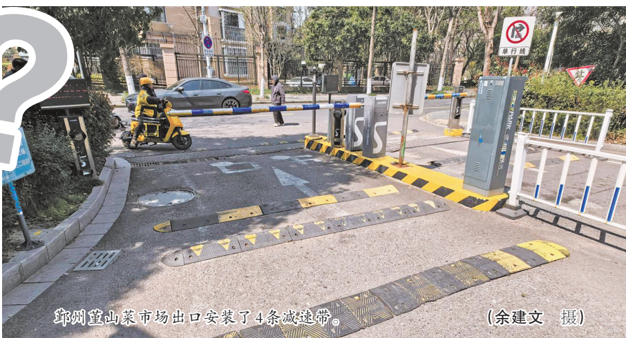
鄞州董山菜市场出口安装了4条减速带。

记者咨询了交通、市政领域相关人士后获悉，目前像城市道路、公路，减速带设置一般由交通、交警等部门负责，也有相应的安装规范。但小区、企事业单位、公共场地这类的停车场，一般由产权单位或属地管理机构负责建设，至于减速带装几条、怎么装，并没有明确的规范。市市政设施中心停车场管理科负责人钟先生说，多年来，他们没有碰到过就减速带设置问题