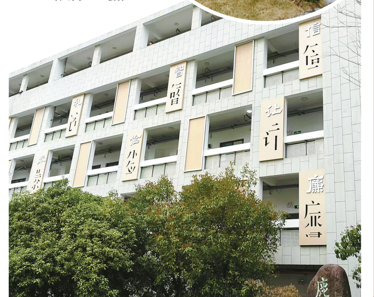
▲校园“廉景”。 ▼“清廉墙”。

在做好专业规范化建设的基础上，近年来，甬江职高以打造“清美”校风为目标，持续推进“一支部一品牌一联建”工程，以每个专业为单位建设党支部，实现党建工作与专业建设“双提升”。如在校企党建联动过程中，该校旅游党支部贴近企业第一线，开展状元楼宁波菜烹制技艺的传承与人才培养，把传统清廉故事和廉洁文化元素融入《大师味道》等校本教材，促进专业提升。