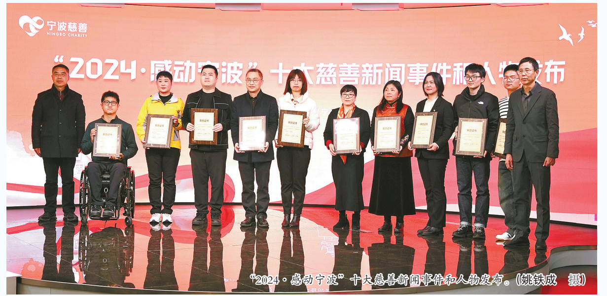
“2024·感动宁波”十大慈善新闻事件和人物发布。

今年3月25日，宁波市慈善总会（宁波市慈善联合会）第五届第五次理事会审议通过了《宁波市慈善总会（宁波市慈善联合会）关于2024年工作情况和2025年工作安排的报告》。报告指出，2024年，市慈善总会募集款物1.06亿元，较上一年增长21.2%，全市两级慈善总会共募集款物10.9亿元。2024年，市慈善总会救助支出9296.4万元，救助困难群众9376人次；全市两级慈善总会共支出9.4亿元，救助困难群众57.5万人次。