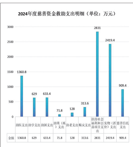
以上为市慈善总会2024年度慈善资金收支情况图表