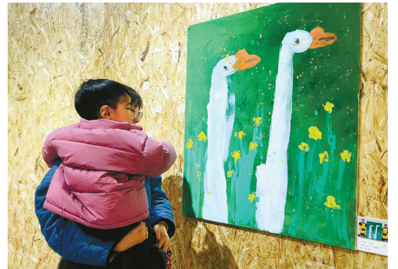
近日，一场主题为“嗨！小小孩儿为你办个展”的绘画展在慈城实验幼教集团维拉托育部拉开帷幕。33幅色彩斑斓、笔触稚嫩的作品吸引了众人的目光。令人惊叹的是，这些作品全部出自年仅2岁的托班幼儿之手。