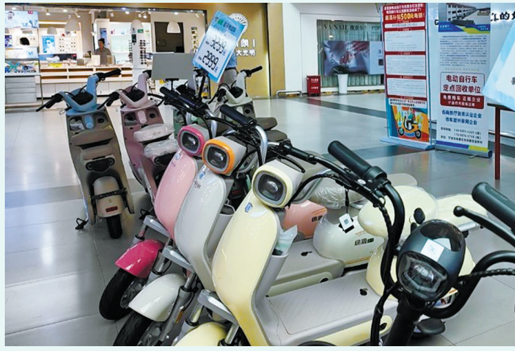
商场里销售的电动自行车。

本报讯(记者孙佳丽)电动自行车以旧换新最新补贴方案落地!昨日,记者从市商务局获悉,市商务局等6部门已经发布关于做好2025年度电动自行车以旧换新相关工作的通知。