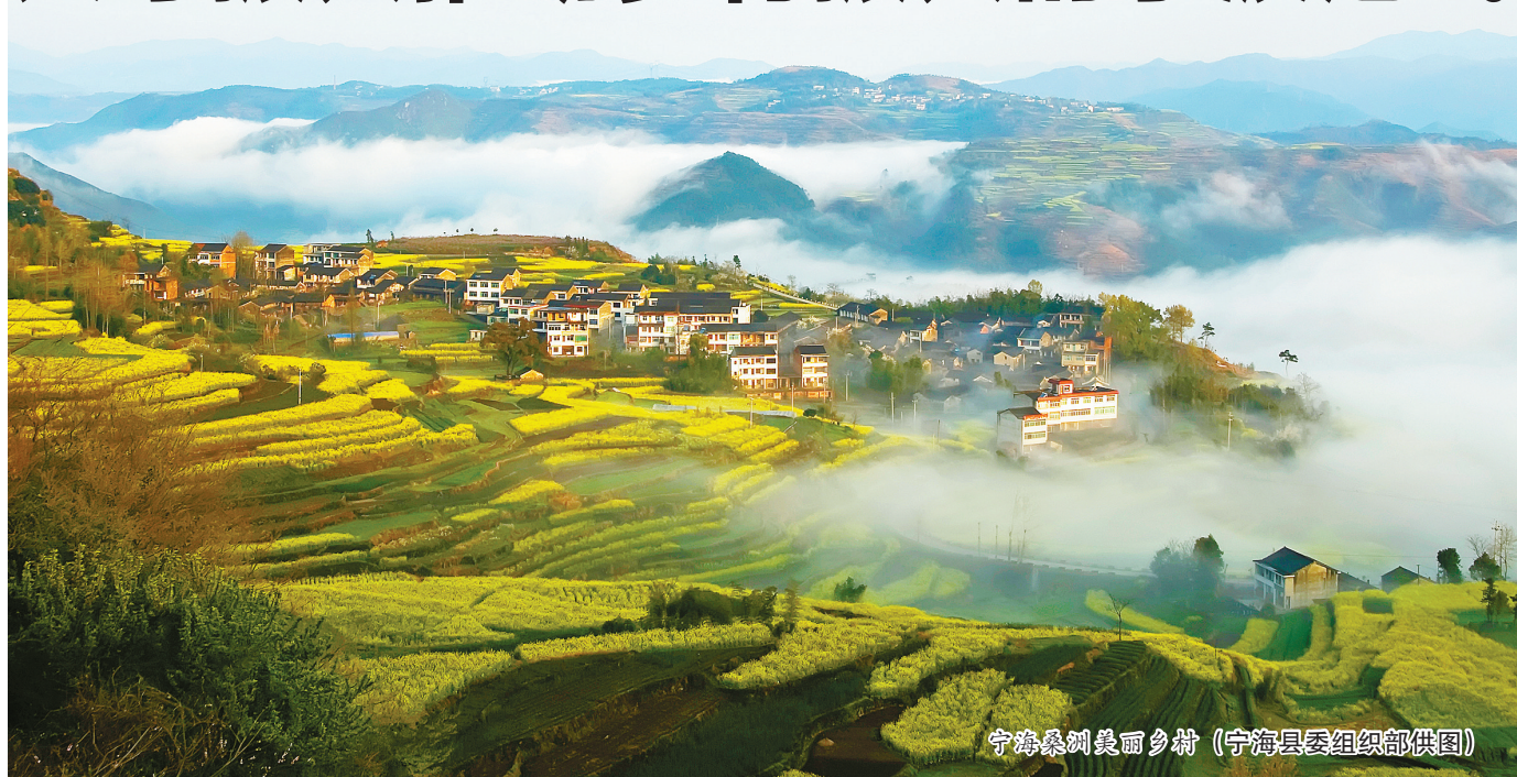
宁海桑洲美丽乡村(宁海县委组织部供图)