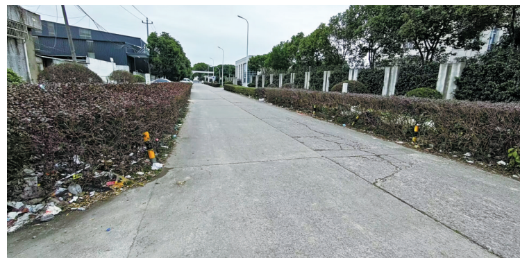
绿化带中布满垃圾。