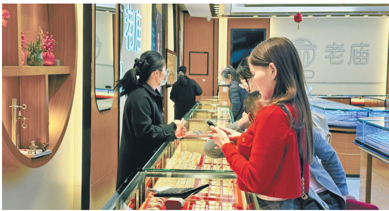
顾客在店里选购黄金饰品。

近期，不少银行对黄金业务进行了调整。中国银行宣布从2月10日起将积存金产品最小购买金额由