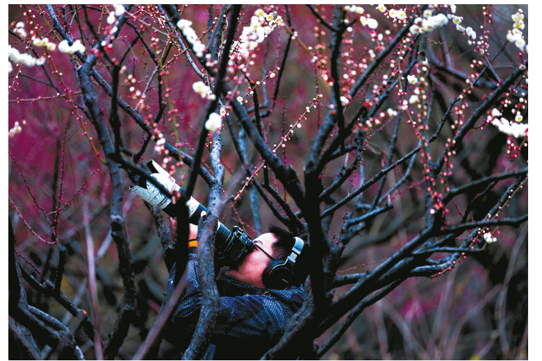
昨日，在宁波植物园，梅花在细雨中散发着别样的韵味。宁波植物园梅园占地约1.7公顷，拥有100余个梅花品种，构成了一片烂漫花海。据了解，宁波植物园中的梅花预计下周迎来最佳观赏期。

下周一，随着新一轮冷空气造访，天气又将转为多云转阴有小雨，最高气温也将大幅下降。从目前的预报趋势来看，下周冷空气和暖湿气流将频繁“交锋”，雨水将成为常客，气温也难以明显回升。市气象台表示，未来七天，雨水和冷空气轮番登场，天气变化较快，市民需及时关注最新预报。