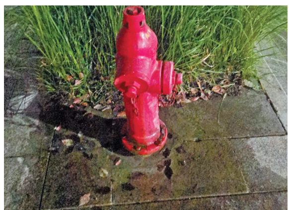
北仑星辰实验幼儿园旁一消火栓长期漏水。

去年9月24日,编号为“8182877”的网友留言反映,北仑春晓星辰实验幼儿园旁有个消火栓长期漏水。第二天,北仑区便上传了春晓街道的回复:您好,已安排,近期会修复。