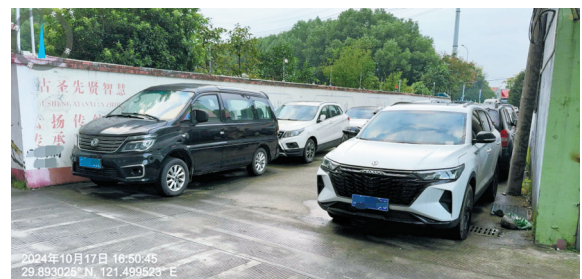
整改前后。

去年9月17日,编号为“8186839”的网友留言咨询:我是江苏无锡某产业园区的工作人员,因园区企业有共享电工需求,想了解一下北仑区新碶大港工业社区“共享电工”的经验做法。如能回复,不胜感激。请问大港工业社区“共享电工”项目自2021年开展以来,目前是否还在实施?企业和电工团队反馈情况如何?如何管理“共享电工”服务团队?企业与“共享电工”之间维修响应是通过网络平台实现,还是线下沟通?