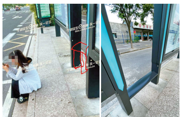
网友建议在公交站牌之间安装座椅。(引自网友跟帖) 座椅安装完毕。(引自网友跟帖)

去年7月28日,网友“欺软怕硬非英雄”反映,慈溪吾悦广场天香桥公交站台没有座位,有些乘客坐在台阶上候车,马路上车来车往,很不安全,能不能给公交站台装把座椅?