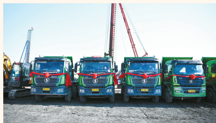
余姚市重大项目“攻坚提速”行动启动仪式现场。

本报讯(见习记者顾佳诚 通讯员劳超杰)昨日，余姚市举行全市重大项目“攻坚提速”行动启动仪式，67个涵盖智能制造、农文旅产业、商贸物流等领域的项目开工建设，总投资达127.71亿元，年度计划投资44.47亿元。